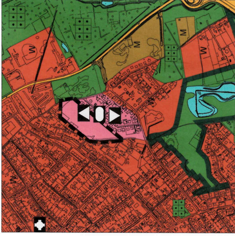
Bisherige Darstellung des seit dem 12.08.1999 rechtswirksamen Flächennutzungsplanes M 1:10 000

PLANZEICHENERKLÄRUNG GEMÄSS PLANZEICHENVERORDNUNG 1990 VOM 18.12.1990