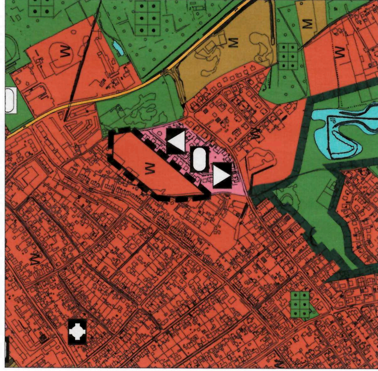
Berichtigte Darstellung des Flächennutzungsplanes M 1: 10 000

GRENZE DES RÄUMLICHEN GELTUNGSBEREICHES DER 2. BERICHTIGUNG