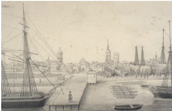
Stralsunder Werftgelände, 1842