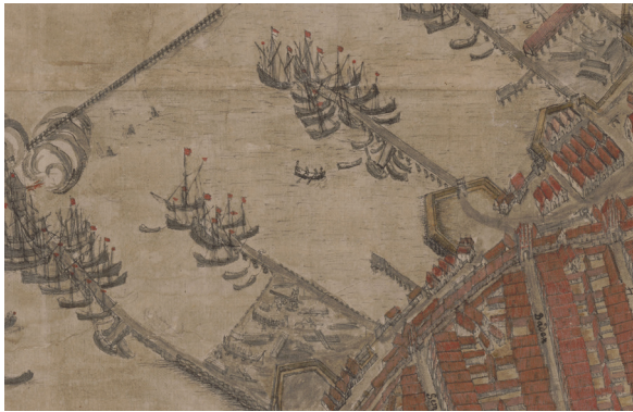
Auszug Stauedeplan, Hafen 1647