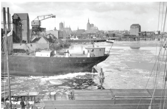
Staatswerft, ca. 1935