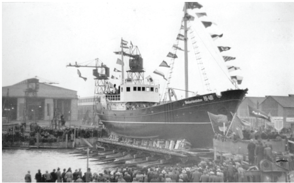
Stapellauf des ersten Loggers von der »Volkswerft«, 1949

Am 15. Juni 2023 jährt sich die Namensverleihung »Volkswerft« an den damals im Entstehen begriffenen Schiffbaubetrieb in Stralsund zum 75. Mal. Als größter Betrieb prägte die Werft das Leben in der Stadt bis in die jüngste Vergangenheit. Tausende Menschen fanden dort Arbeit, ganze Stadtteile wurden deshalb neu gebaut und die 1996 fertiggestellte Schiffbauhalle ist unübersehbarer Teil des Stadtbildes.