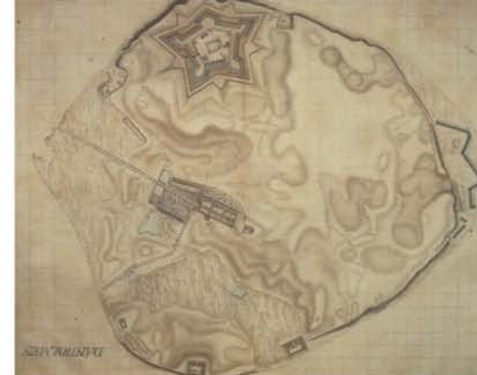
Links aussen: Plan von Stralsund und der umliegenden Gegend zur Zeit der Wallensteinschen Belagerung 1628, Gez. Von W. Brüggemann 1828, Stadtarchiv Stralsund