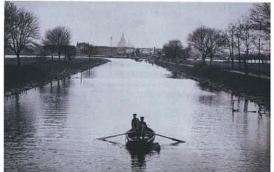
Westliche Zufahrt zum Dänholm-Hafen, um 1880, Postkarte, 2)

umfangreichen baulichen Erweiterungen auch für das Anlegen von Kastanien-, Eschen- und Ahornalleen entlang wichtiger Wegeverbindungen, die zum Teil schon seit der Schwedenzeit nachweisbar sind, sowie für gezielte Gehölzanpflanzungen auf der Sternschanze und den Grünflächen zwischen den militärischen Gebäuden. Von dem Gebäude des späteren Gasthauses führte bereits zu Beginn des 19. Jahrhunderts eine Allee zum Fähranleger, die in Teilen noch zu erleben ist.