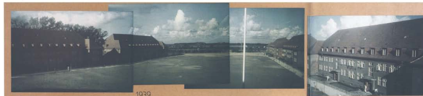
Exerzierplatz auf dem Dänholm, Photomontage, 1939, 1)

Im Verlauf der Jahre entstand jedoch durch eine relativ ungestörte Entwicklung der Vegetation ein Gehölzgürtel entlang der Uferbereiche des Dänholms, der heute sehr zu der seeseitigen Wirkung als grüne Insel mit nur wenigen Sichten auf die Bebauung beiträgt. Weiträumige Blicke öffnen sich hingegen noch längs des Hafenbeckens in Richtung Stadt auf die